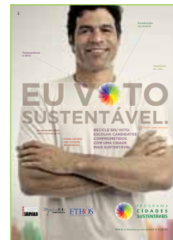
Anúncio: Agência DPZ