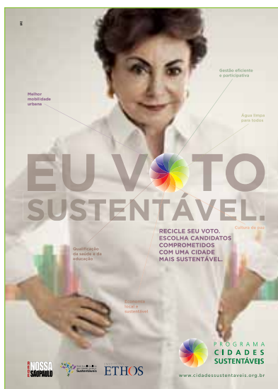
Anúncio: Agência DPZ