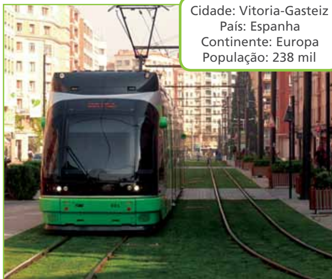
Cidade: Vitoria-Gasteiz País: Espanha Continente: Europa População: 238 mil

As informações que estiverem indisponíveis deverão ser mencionadas no relatório de prestação de contas. Na elaboração de indicadores que não forem de responsabilidade direta dos municípios, cabe a estes requisitarem as informações aos órgãos competentes.