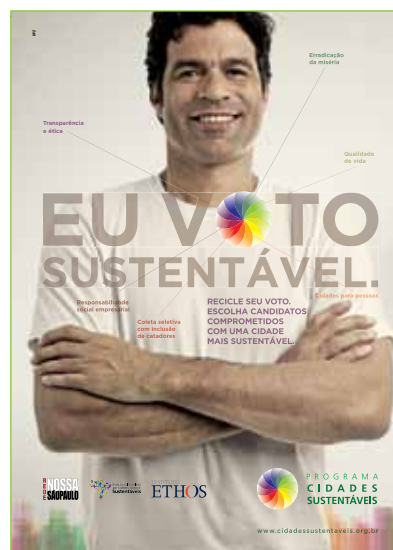
Anúncio: Agência DPZ

Um vídeo institucional dirigido pela cineasta Luciana Burlamaqui apresenta o Programa Cidades Sustentáveis e chama a sociedade para o envolvimento nesse grande desafio de construir um novo modelo de desenvolvimento urbano que vise à sustentabilidade. O vídeo está disponível, na íntegra, no site.