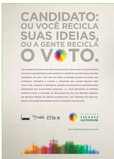
Anúncio: Agência DPZ

Uma parceria com a agência DPZ deu origem à campanha publicitária dirigida aos eleitores e aos candidatos(as) a prefeitos(as) nas eleições municipais de 2012. Nesta primeira etapa, sob o slogan “Eu voto sustentável”, o atleta Raí Oliveira e a atriz Beatriz Segall participaram voluntariamente.