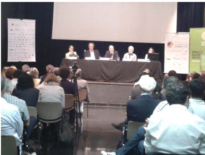
Figura 8: II Encontro com os signatários do Programa Cidades Sustentáveis. 136 representantes de 63 cidades estiveram presentes.

10 e 11/4 – Com o objetivo de auxiliar as prefeituras a colocarem em prática as ações previstas na plataforma e estimular a troca de informações e experiências entre as gestões que aderiram à carta-compromisso, foi realizado, em São Paulo, o II Encontro com os signatários do Programa Cidades Sustentáveis. 136 representantes de 63 cidades estiveram presentes. No primeiro dia do evento, houve o lançamento dos materiais pedagógicos e informativos, na forma de vídeos e de guia, sobre cada um dos 12 Eixos Temáticos do PCS e para a plataforma em geral. No segundo dia, foi realizado o seminário que discutiu a implementação da Política Nacional de Resíduos Sólidos (Lei 12.305/10 e Decreto nº 7404/10) nos municípios brasileiros. O seminário foi organizado pela Fundação Avina, em parceria com o Programa Cidades Sustentáveis.