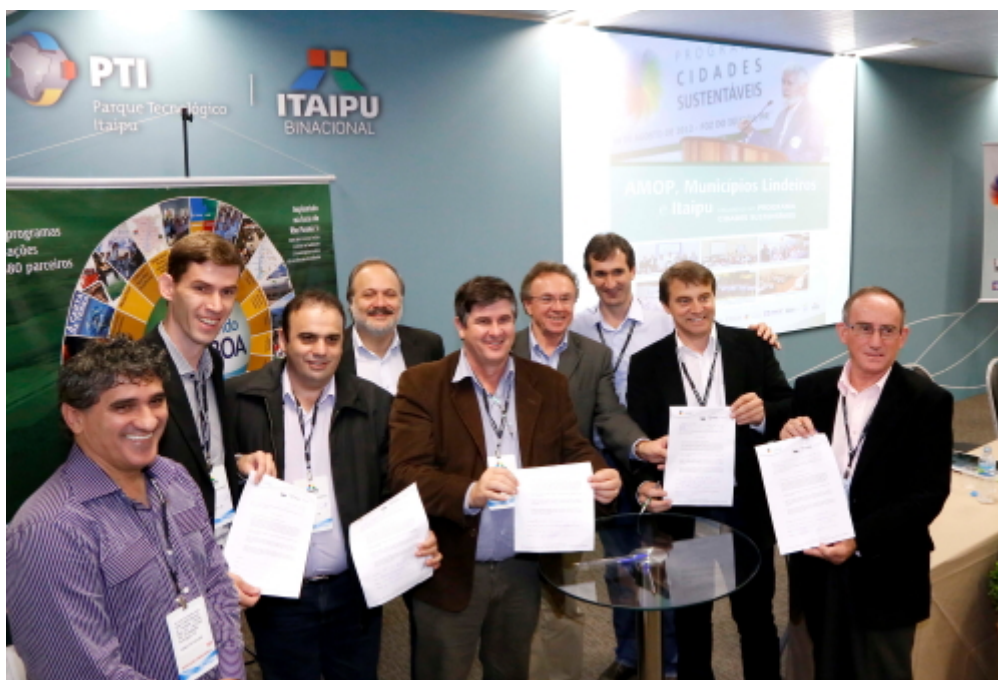
Figura 12: Diversos prefeitos do Oeste do Paraná assumiram os compromissos com o Programa Cidades Sustentáveis.

19/6 – Apresentação do PCS no Encontro com prefeitos que integram a Associação dos Municípios do Oeste do Paraná (Amop). Na oportunidade, diversos prefeitos da região assumiram os compromissos com o Programa Cidades Sustentáveis.