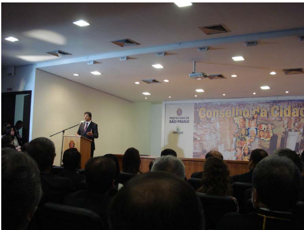
Figura 7: Reunião inaugural do Conselho da Cidade, que reúne aproximadamente cem lideranças da sociedade paulistana. Nessa reunião foi lançado o Programa de Metas 2013-2016.