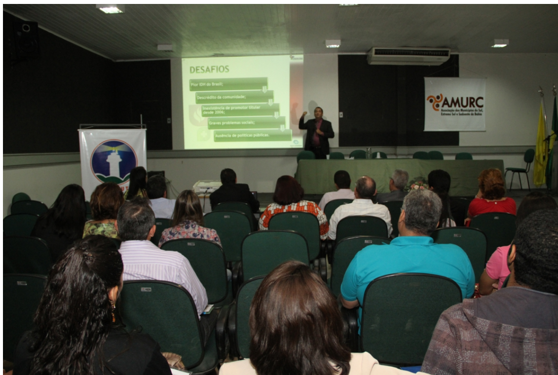
Figura 14: Apresentação do PCS no Seminário Municípios Sustentáveis, realizado em Itabuna (BA).

25/7 – Apresentação do PCS no Seminário Municípios Sustentáveis, realizado em Itabuna (BA). O encontro foi promovido pela Associação dos Municípios do Sul, Extremo Sul e Sudoeste Baiano (AMURC), em parceria com o Instituto Nossa Ilhéus, Ministério Público, Uesc e Unime, e chamou a atenção de técnicos, secretários, prefeitos e a sociedade civil organizada para a necessidade urgente de implementar práticas bem sucedidas a uma realidade de desgaste na administração municipal.