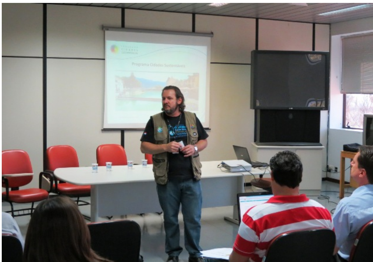
Figura 15: Lançamento do PCS em Santa Helena (PR).

06/8 – Lançamento do PCS em Santa Helena (PR).