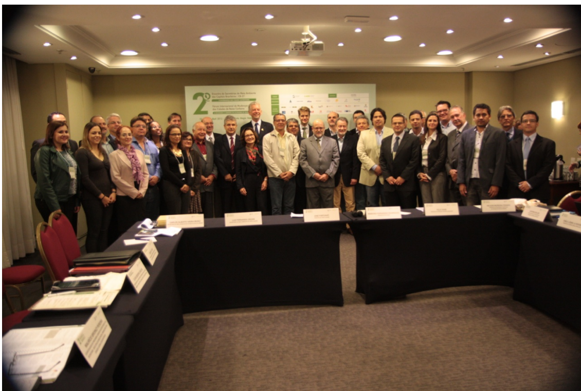
Figura 9: 2º Encontro dos Secretários de Meio Ambiente das Capitais Brasileiras (CB27), com o tema “A Governança nas Cidades Sustentáveis”.

22/4 – Participação no 2º Encontro dos Secretários de Meio Ambiente das Capitais Brasileiras (CB27), com o tema “A Governança nas Cidades Sustentáveis”. O evento foi realizado pela Secretaria Municipal de Meio Ambiente de Porto Alegre e pelo Instituto Latino Americano de Desenvolvimento Econômico Sustentável, em Porto Alegre (RS).