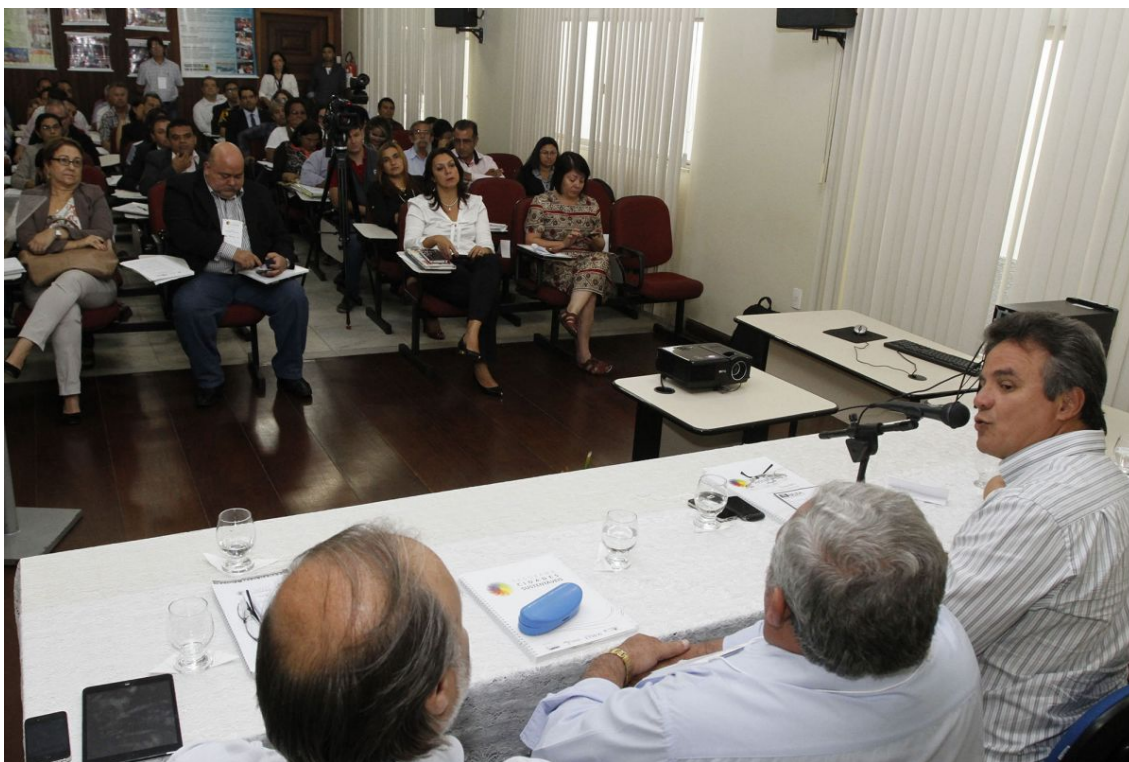
Figura 20: O PCS realiza o curso de capacitação “Gestão Pública Sustentável” para os gestores públicos e técnicos das prefeituras signatárias do Estado do Pará.

21/10 – O PCS realiza o curso de capacitação “Gestão Pública Sustentável” para os gestores públicos e técnicos das prefeituras signatárias do Estado do Pará. O encontro foi realizado em Belém (PA). Na oportunidade, a FAMEP - Federação das Associações dos Municípios do Estado do Pará assinou o Protocolo de Intenções em apoio ao programa.