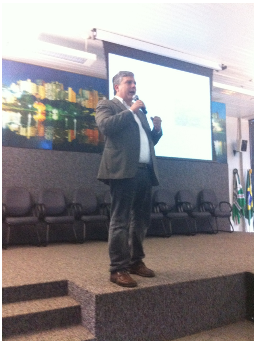
Figura 21: O PCS realiza o curso de capacitação “Gestão Pública Sustentável” para gestores públicos e técnicos das prefeituras signatárias do Estado de Goiás.

30/10 – O PCS realiza o curso de capacitação “Gestão Pública Sustentável” para gestores públicos e técnicos das prefeituras signatárias do Estado de Goiás. O encontro foi realizado em Goiânia (GO). Na oportunidade, o Presidente da Federação Goiana de Municípios (FGM) assinou o Protocolo de Intenções em apoio ao PCS.