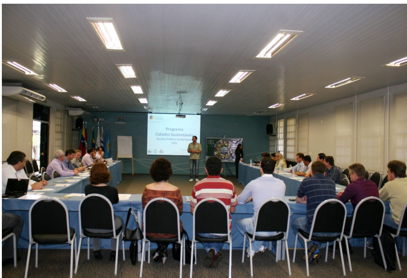
Figura 16: Curso de capacitação “Gestão Pública Sustentável” em Foz do Iguaçu (PR).

21/8 – O PCS realiza o curso de capacitação “Gestão Pública Sustentável” em Foz do Iguaçu (PR). O momento marcou a integração das equipes de governo que trocaram experiências, bem como sugeriram algumas iniciativas, entre elas, a de marcar uma reunião com as equipes de governo dos municípios que aderiram ao programa, para que todos os setores sejam sensibilizados e cooperem com a atualização dos indicadores.