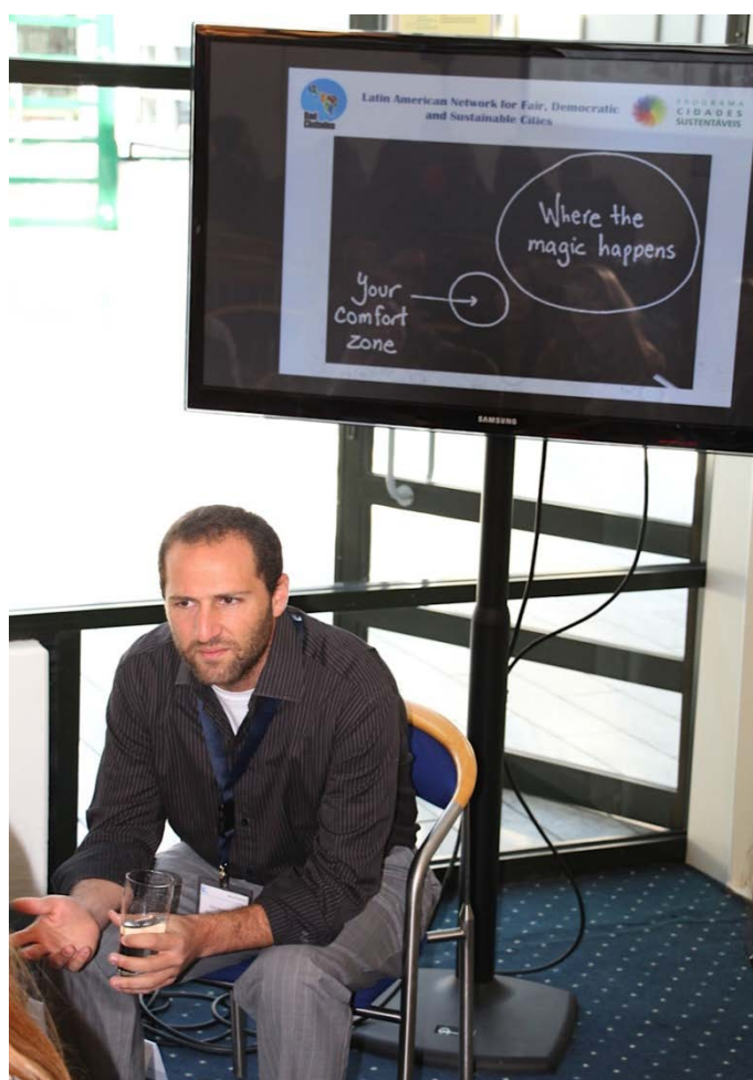
Figura 11: Apresentação do PCS na 24ª edição da Assembleia e Conferência Geral Anual do Centro Europeu de Fundações (CEF), em Copenhague, na Dinamarca.

30/5 a 1/6 – Apresentação do PCS na 24ª edição da Assembleia e Conferência Geral Anual do Centro Europeu de Fundações (CEF), em Copenhague, na Dinamarca. No evento, com a temática "cidades sustentáveis e o futuro urbano", O PCS foi apresentado no painel "Apoio à participação cidadã: ferramentas e estratégias".