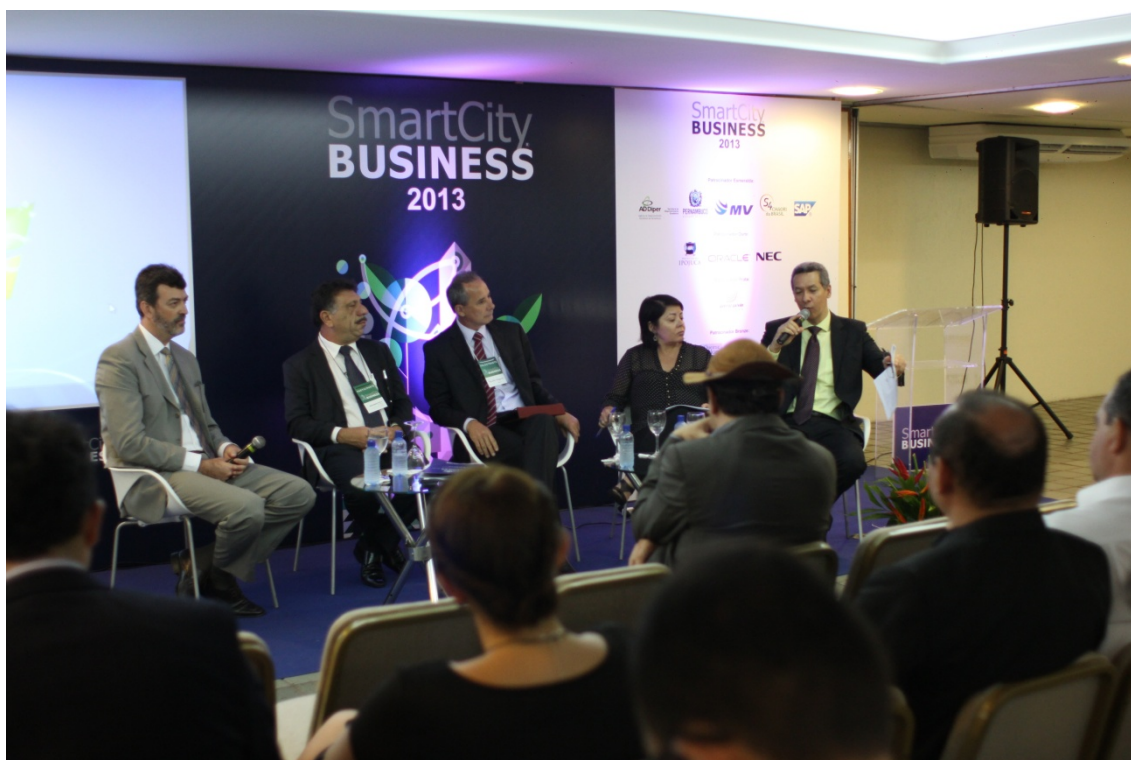
Figura 22: Participação do PCS do Smart City Business, uma iniciativa da Associação de Dirigentes de Vendas e Lojistas de Pernambuco.

de Municípios de Pernambuco (AMUPE) assinou o Protocolo de Intenções em apoio ao PCS.