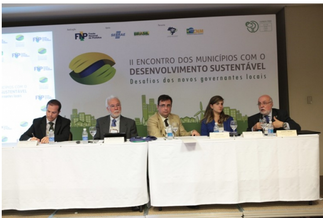
Figura 10: O Programa Cidades Sustentáveis integrou a programação do 2º Encontro dos Municípios com o Desenvolvimento Sustentável, promovido pela Frente Nacional de Prefeitos, com o apoio do Sebrae e do Governo Federal, em Brasília.

23 a 25/4 – O Programa Cidades Sustentáveis integrou a programação do 2º Encontro dos Municípios com o Desenvolvimento Sustentável, promovido pela Frente Nacional de Prefeitos, com o apoio do Sebrae e do Governo Federal, em Brasília. O evento foi realizado em parceria com a Confederação Nacional dos Municípios e a Associação Brasileira dos Municípios.