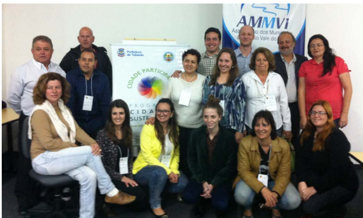
Figura 18: O PCS realiza o curso de capacitação “Gestão Pública Sustentável” em Blumenau (SC).

30/9 – O PCS realiza o curso de capacitação “Gestão Pública Sustentável” em Blumenau (SC). Participaram dos cursos os gestores públicos e técnicos das prefeituras signatárias do Estado de Santa Catarina. O objetivo foi auxiliar os gestores públicos e técnicos para colocarem em prática uma agenda de sustentabilidade em suas cidades, baseada nos 12 eixos do Programa Cidades Sustentáveis. Na oportunidade a Associação dos Municípios do Médio Vale do Itajaí (AMMVI) e a Associação de Municípios da Região de Laguna (AMUREL), assinaram o Protocolo de Intenções em apoio ao Programa Cidades Sustentáveis.