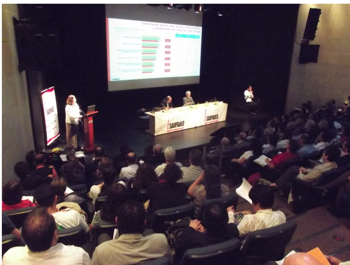
Figura 2: Lançamento da 6ª pesquisa encomendada ao Ibope sobre a percepção dos paulistanos em relação à cidade, que inclui a 4ª edição do IRBEM (Indicadores de Referência de Bem-Estar no Município).

17/1 – Lançamento da 6ª pesquisa encomendada ao Ibope sobre a percepção dos paulistanos em relação à cidade, que inclui a 4ª edição do IRBEM (Indicadores de Referência de Bem-Estar no Município). Na ocasião, ainda, os GTs que integram a Rede Nossa São Paulo apresentaram sugestões de metas para o prefeito, tendo como base as demandas da sociedade.