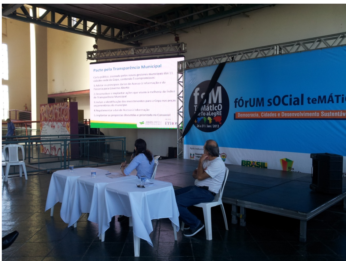
Figura 4: Seminário sobre Controle Social e Transparência, dirigido à sociedade civil durante o Fórum Social Temático.

30/1 – Durante Fórum Social Temático, em Porto Alegre (RS), foi realizado o Seminário sobre Controle Social e Transparência, dirigido à sociedade civil.