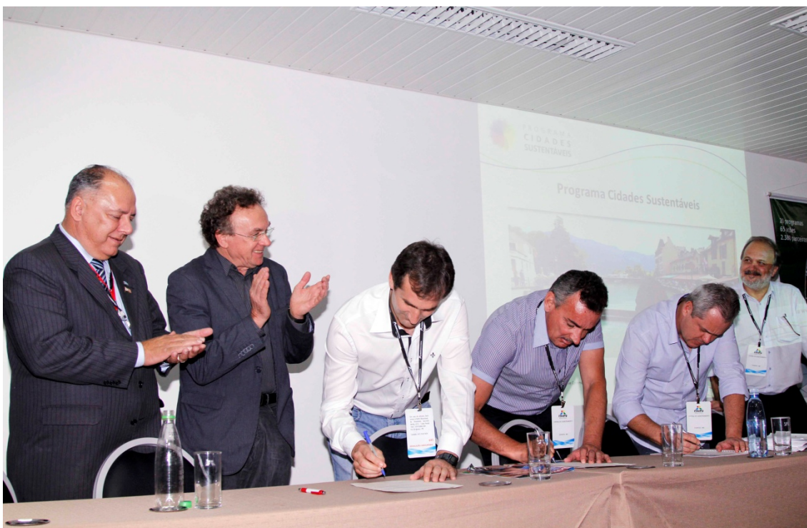
Figura 1: Apresentação do PCS que reuniu em Foz do Iguaçu prefeitos eleitos e reeleitos e em final de mandato.

9/11 – Apresentação do PCS na assembleia da Associação dos Municípios do Oeste do Paraná (Amop), que reuniu em Foz do Iguaçu prefeitos eleitos, reeleitos e em final de mandato.