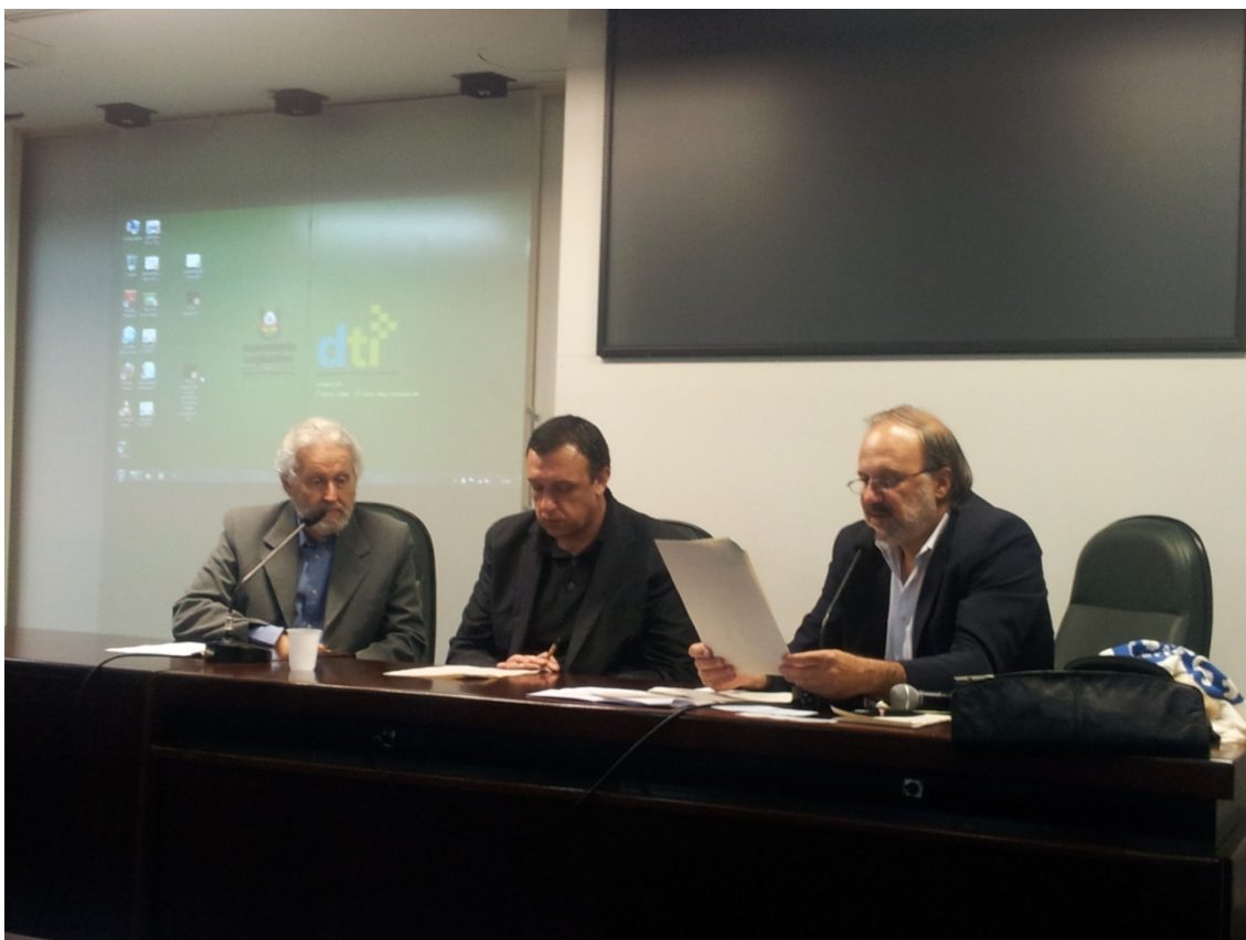
Figura 3: Realização do Seminário do Programa Cidades Sustentáveis – Inovação e Sustentabilidade na Gestão Municipal, na Assembleia Legislativa do Estado do Rio Grande do Sul. O seminário fez parte do Fórum Social Mundial Temático.

29/1 – Realização do Seminário do Programa Cidades Sustentáveis – Inovação e Sustentabilidade na Gestão Municipal, na Assembleia Legislativa do Estado do Rio Grande do Sul. O seminário fez parte do Fórum Social Mundial Temático e reuniu representantes das prefeituras signatárias do PCS.