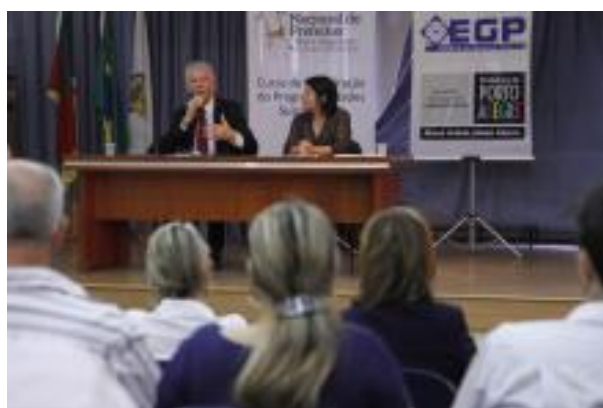
Figura 24: PCS realiza o curso de capacitação “Gestão Pública Sustentável” para gestores públicos e técnicos das prefeituras signatárias do Estado do Rio Grande do Sul.

27/11 – PCS realiza o curso de capacitação “Gestão Pública Sustentável” para gestores públicos e técnicos das prefeituras signatárias do Estado do Rio Grande do Sul. O encontro foi realizado em Porto Alegre (RS), e contou com o apoio da Frente Nacional de Prefeitos, Prefeitura Municipal de Porto Alegre e a Federação das Associações de Municípios do Rio Grande do Sul (Famurs).