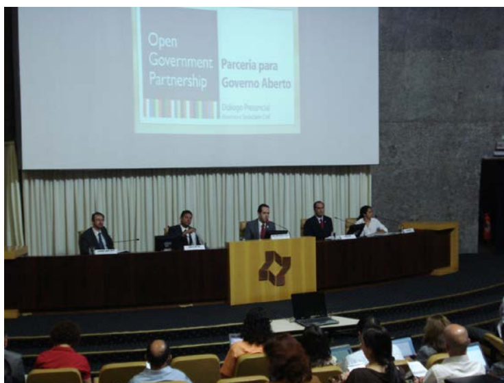
Figura 6: Participação, Encontro “Diálogos Governo e Sociedade Civil – OGP” em Brasília, que reúne organizações da sociedade civil e representantes da administração federal para elaborar compromissos para o novo Plano de Ação Brasileiro sobre Governo Aberto.

13/3 – Participação, em Brasília, do encontro “Diálogos Governo e Sociedade Civil – OGP”, que reúne organizações da sociedade civil e representantes da administração federal para elaborar até 15 propostas de compromissos para o novo Plano de Ação Brasileiro sobre Governo Aberto.