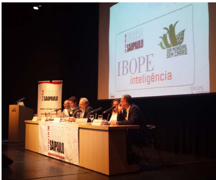
Figura 17: Lançamento da sétima pesquisa encomendada pela Rede Nossa São Paulo ao Ibope, sobre a mobilidade urbana na cidade de São Paulo.

20/9 – Participação do PCS no TEDx City 2.0 – Cidades Sustentáveis, que teve o objetivo de apresentar pensadores e criadores com inovações que buscam modificar suas cidades.