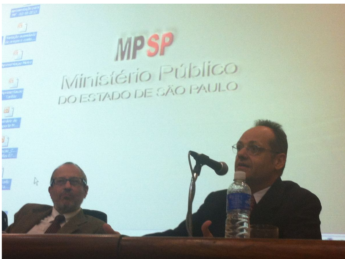
Figura 19: Participação no Fórum Mobilidade Urbana: Tarifa e Financiamento – alternativas para a Região Metropolitana de São Paulo.

7 e 8/10 – Participação no Fórum Mobilidade Urbana: Tarifa e Financiamento – alternativas para a Região Metropolitana de São Paulo. O evento foi organizado pela Rede Nossa São Paulo, a Procuradoria Geral de Justiça, a Escola Superior do Ministério Público e a Promotoria de Justiça e Urbanismo da Capital. O objetivo foi colher subsídios para instruir o Inquérito Civil número 362/13, instaurado em 11/6 para estudar a composição tarifária dos meios de transporte público na cidade de São Paulo e agora expandindo para a Região Metropolitana. O tema também foi proposto pelo Conselho Nacional do Ministério Público (CNMP) e Grupo Nacional de Direitos Humanos (GNMD).