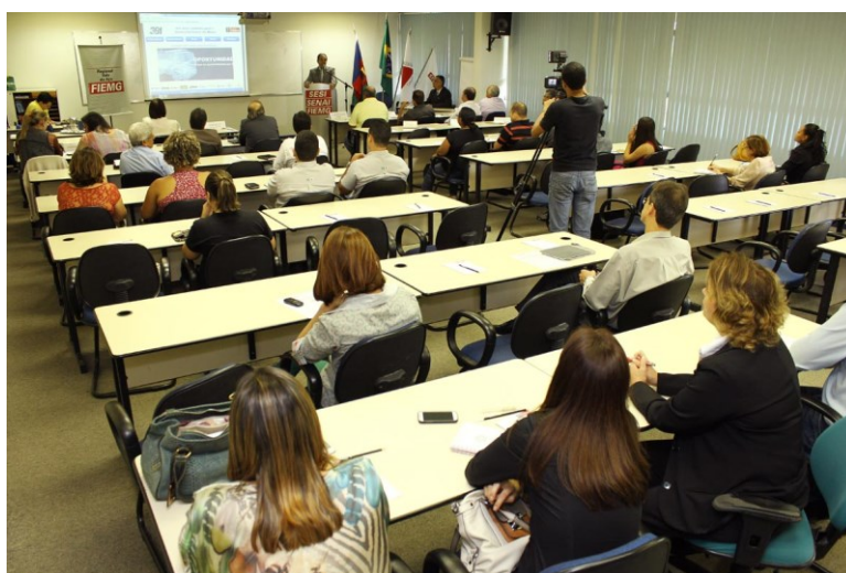
Figura 23: PCS participa do seminário “Cooperação para Cidades Sustentáveis”, realizado em Ipatinga (MG).

25/11 – PCS participa do seminário “Cooperação para Cidades Sustentáveis”, realizado em Ipatinga (MG). O evento foi realizado pela FIEMG Vale do Aço, e pautou a inserção de uma agenda de sustentabilidade pelos administradores municipais de Belo Oriente, Caratinga, Coronel Fabriciano, Inhapim, Ipaba, Ipatinga, Manhuaçu, Marliéria, Santana do Paraíso e Timóteo, que assinaram voluntariamente a carta-compromisso do PCS.