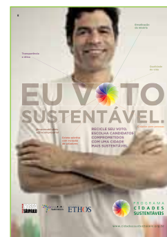
Anuncio: Agencia DPZ