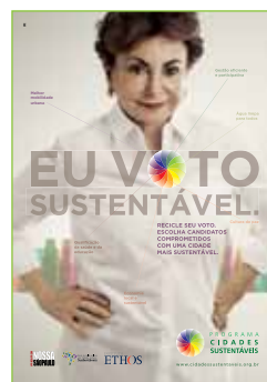
Anuncio: Agencia DPZ